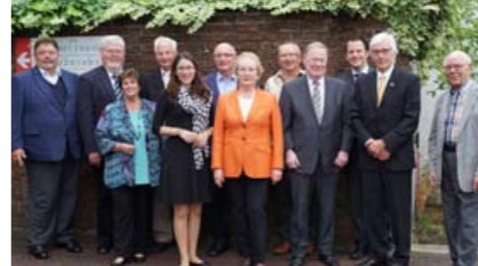
Jubilarehrung der CDU Pulheim