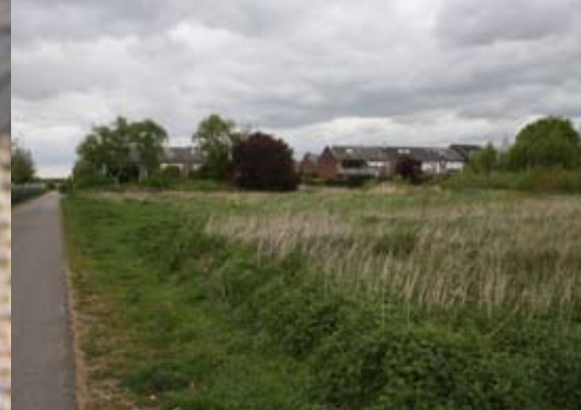
Geplante Baufläche BP 134 hinter dem Sportplatz