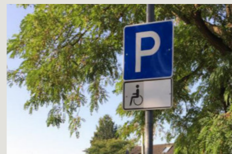
Neuer Behindertenparkplatz an der Pulheimer Straße